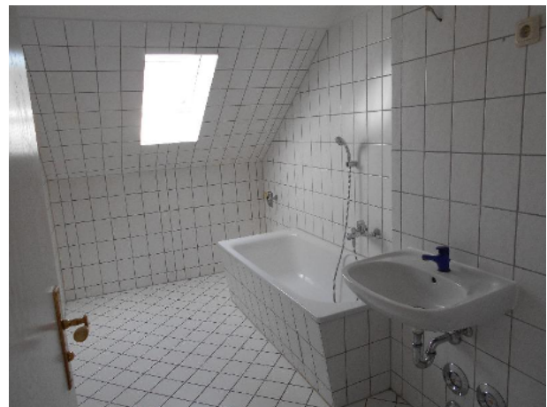
Bad mit Wanne