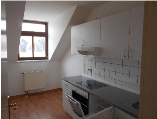
Küche mit EBK