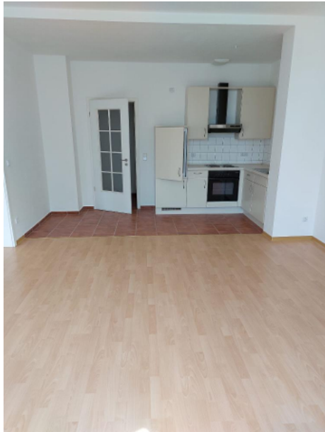
Wohnen / Kochen